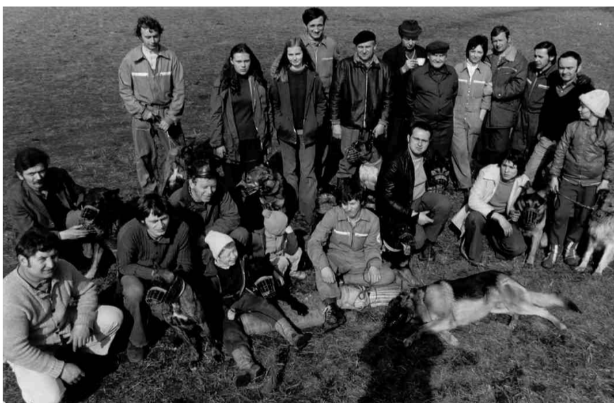
Po nedělním výcviku. Sedmdesátá léta.