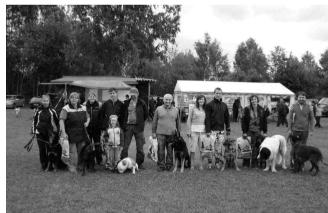
Společné foto Náchodských "pejskařů" ze závodu o "Putovní pohár města Broumova", rok 2011.