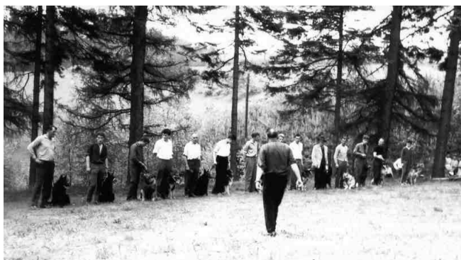
Cvikiště na Vojenském hřbitově v Náchodě.