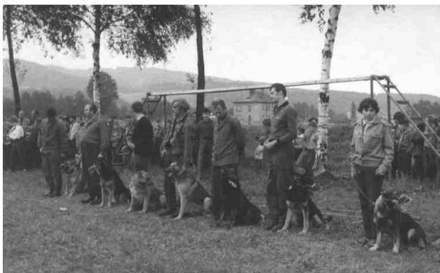
Ukázka výcviku pro polské harcery, Náchod - celnice. Zprava – Hofmanová, Manych, Prouza, ?, ?, Petřů.