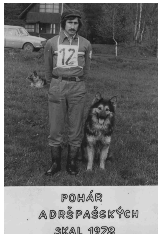
Pohár Adršpašských skal 1978

Součástí života organizace se stalo od roku 2003 pořádání „Pejskařského plesu“ tradičně v Sokolovně Náchod, nejen pro členy, ale i pro širokou veřejnost. A co popřát kynologickému dění v Náchodě do dalších let? Především, aby se tento sport nadále úspěšně rozvíjel, aby to byli právě organizovaní kynologové, kteří budou dokazovat široké veřejnosti, že pes je skutečným přítelem člověka. A že do dnešního přetechizovaného světa pes patří, že není na obtíž svému okolí a v některých oblastech je nepostradatelný pro své schopnosti, jako je vyhledávání drog, záchrané práce, služba nejen v ozbrojených složkách, canisterapie, atd. Toto vše ovšem záleží především na nás, lidech, organizovaných v kynologických organizacích, jak se budeme schopni prezentovat před veřejností. Samotné organizaci přejme, aby se dále rozvíjela, a vždy se našlo dost fandů a obětavců, kteří budou ochotni se spolupodílet na rozvoji organizace, na výcviku a výchově psů a vytvářet tak dobré podmínky co nejširšímu okruhu zájemců o tento ušlechtilý, ale náročný sport.