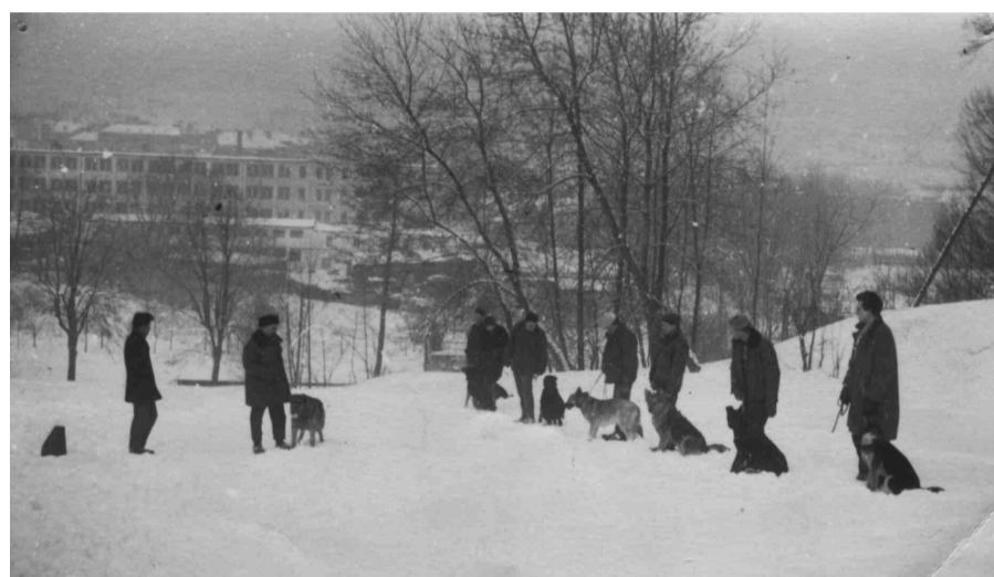
Začátky - Tichý důl - zima 1964 - 1965