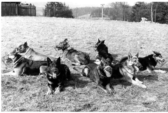
Skupinové odložení psů vleže. Psi musí setrvat v této poloze až do příchodu psovodů.