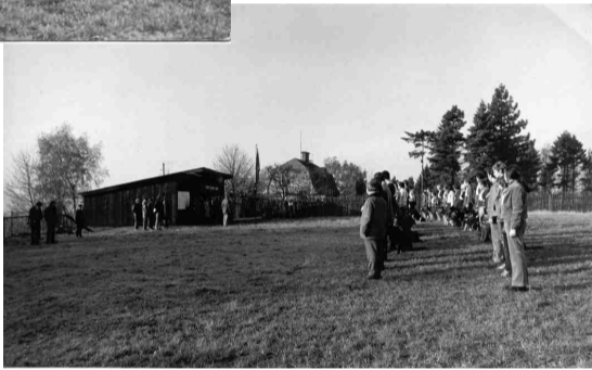
Nástup závodníků na starém cvičišti Kašparáku. Závod "28. října", rok 1975.